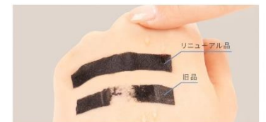
※人工汗液を3回塗布し、擦った状態で比較

3回水をかけてこすっても落ちにくくどんなシーンでも心強い、水・汗・涙に強いウォータープルーフタイプ。また、簡単にこすらず落とせるお湯落ちタイプで、メイクオフの時までまつ毛・目元への負担がなくなるようこだわりの設計です。